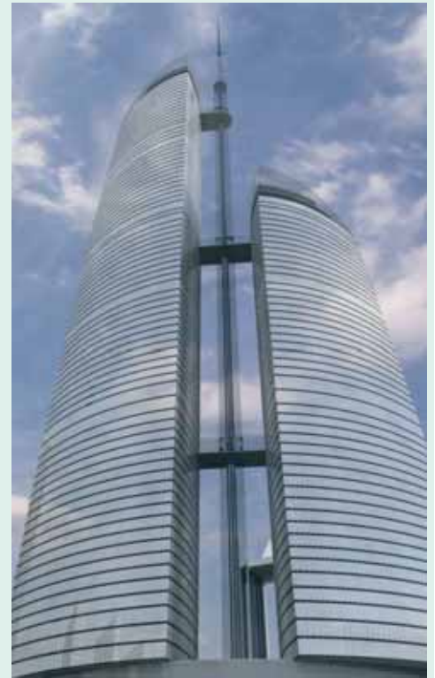
Fra 2008 er Federation Tower i Moskva Europas højeste bygning.

For at opnå tilpas varme, godt indeklima og passende tryk på vandledningerne bliver der installeret Wilo-pumper i B-tårnet. Tilsammen kommer Wilo til at levere langt over 300 pumper, fra de mindre vådløbere som Stratos 30/1-12PN16 og pumper fra TOP-S-produktprogrammet til de store tørløberpumper fra Crono Inline produkt-programmet, gigantiske normpumper og diverse afløbspumper såvel som komplette