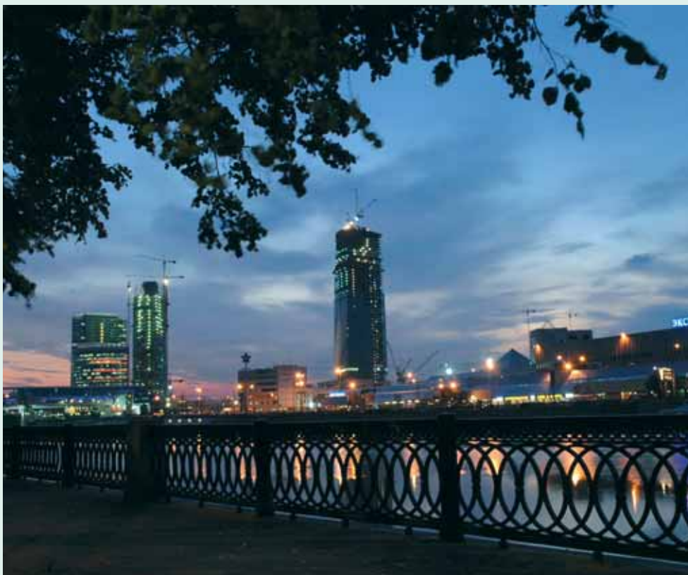
Moskvas fremtidige erhvervscentrum er i øjeblikket ved at blive bygget på Krasnopresnenskaya Embankment".